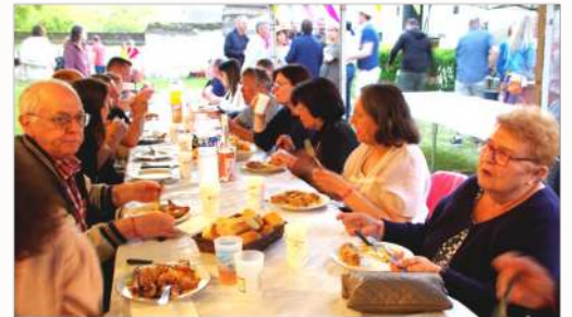
Fin de soirée...La nuit est avancée...