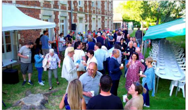
Visite du commandant et des gendarmes de la brigade d'Estrées