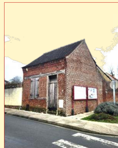
88 rue de l'église